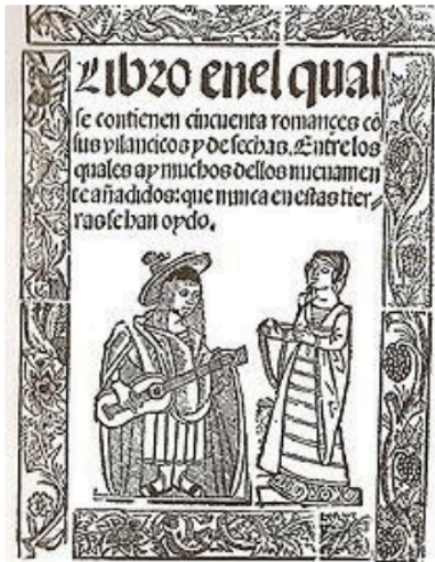
Portada del Libro de los cincuenta romances .

En un principio, la palabra "romance" servía para definir a la lengua vulgar frente al latín. Es hacia el siglo XV cuando se emplea para referirse a una composición poética extensa, octosilábica, cuyos versos pares riman en asonancia . Debemos distinguir: